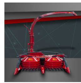
Cztero / pięć - rzędowa BIGDRUM 3000