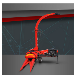
Jednorzędowa MC10X (paski)