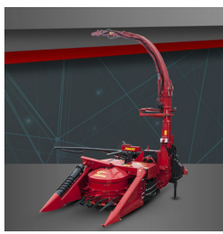
Dwurzędowa BIGDRUM 1250