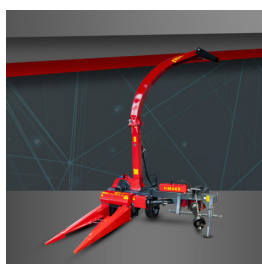
Jednorzędowa MS12SL (przekładnia)