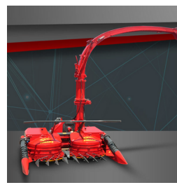
Trzyrzędowa BIGDRUM 2200