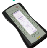
sterownik DigiDevice z płynną regulacją dawki względem prędkości