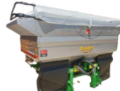
zbiornik ze stali nierdzewnej INOX