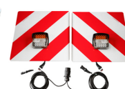
zestaw drogowy LED