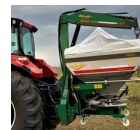
podnośnik do BigBag