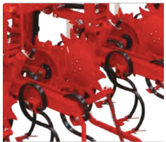
dyski chroniące uprawę