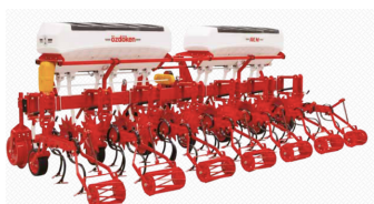
podsiewacz nawozów PCV