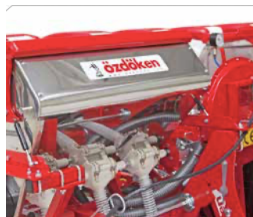
podsiewacz nawozów INOX