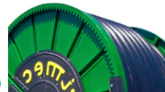
tryb napędowy na zewnętrznej części szpuli