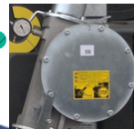
niezależna turbina, zapobiegająca zanieczyszczeniu wody