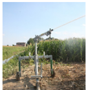
przedłużki do kukurydzy