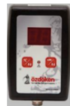
Sterownik ścieżek technologicznych