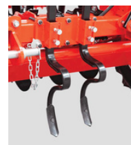
Spulchniacze śladów ciągnika