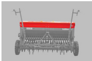
Nadstawki zbiornika nasiennego / nasienno-nawozowego