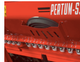
Zestaw do kalibracji