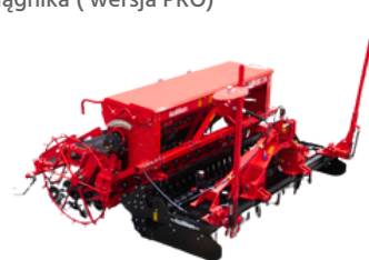
Dostępna również wersja nadbudowana PERTUM CS

Wyłączny Importer i Dystrybutor w Polsce: