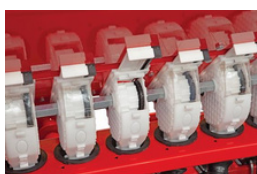
Możliwość szybkiego przebrojenia na wysiew grubo/drobnonasiennych.