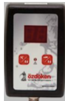
Sterownik ścieżek technologicznych