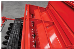
Skrzynia dzielona ziarno / nawóz