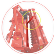
Regulowana wiółka tylna