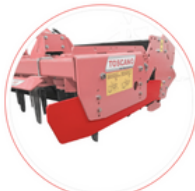
Regulowane ekrany boczne